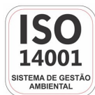
Empresa Certificada ISO 14001:2004