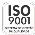
Empresa Certificada ISO 9001:2008