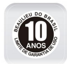
Selo de garantia de performance - PA